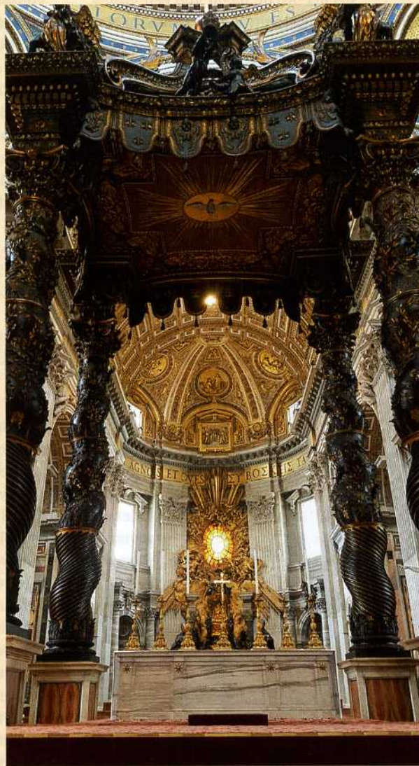
Sint Pieter

wilde een discussie op gang brengen, maar in de praktijk stond hij op tegen Rome. Daar was veel moed voor nodig. Hij had ook kunnen kiezen voor een leven zonder al te veel complicaties. Gewoon zijn werk doen en verder geen gedoe, maar dat kon hij niet. Hij